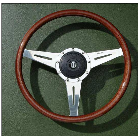
Exécution 14", plat, branches à fentes. Cache central standard.

Mark9 : Nous pouvons également vous proposer une gamme de volants réalisés en essences nobles (Noyer ou Acajou). Ces volants sont comparables aux plus belles réalisations disponibles sur la plupart des GT italiennes des années 50 et 60. Disponible en 13" (33cm), 14" (35.5cm), 15" (38cm) ou - sur demande - en 16" (40.5cm) de diamètre. Les branches percées de trous sont les plus courantes. Des exécutions à fentes, ajourées ou pleines sont également disponibles. Tous les modèles sont réalisés soit plats soit tulipés. Il trouve sa place dans un très grand nombre d'automobiles classiques.