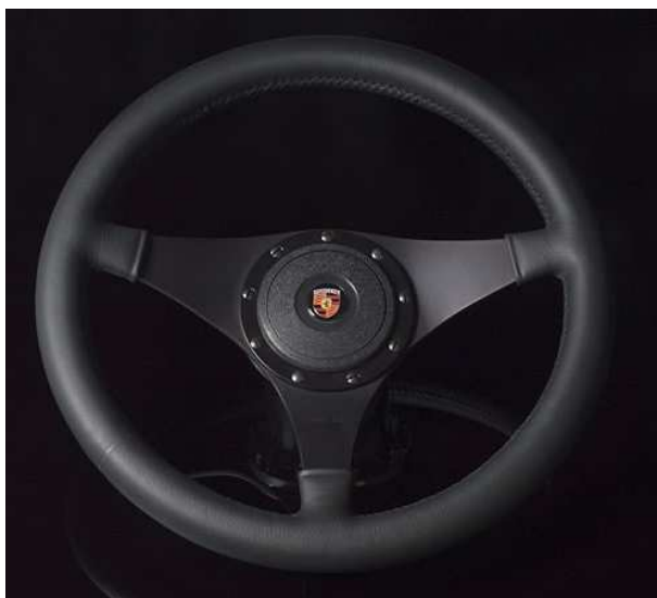
Exécution 14", tulipé, branches noires, cache standard, badge Porsche.

Eagle 3: Exécution moderne à 3 branches en cuir. Ce modèle est uniquement disponible en 14". Branches noires ou alu poli, plat ou tulipé.