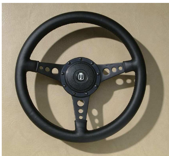
Mark 4, branches noires à trous, cache standard noir.

Mark 4 : C'est le volant anglais en cuir par excellence. D'un design intemporel, il est disponible dans de nombreuses exécutions. Plat avec branches pleines dans les diamètres de 10" (25.5cm) et 11" (28cm). Tulipé ou plat avec branches pleines en 12" (30.5cm). Enfin, dans les dimensions 13" (33cm), 14" (35.5cm) et 15" (38cm), plat ou tulipé avec des branches pleines, percées de trous, fendues ou ajourées. Chaque version est disponible avec une finition éloxée noire ou en aluminium poli.