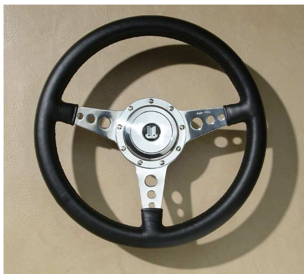
Mark 4, branches alu poli à trous, cache en alu poli (option).