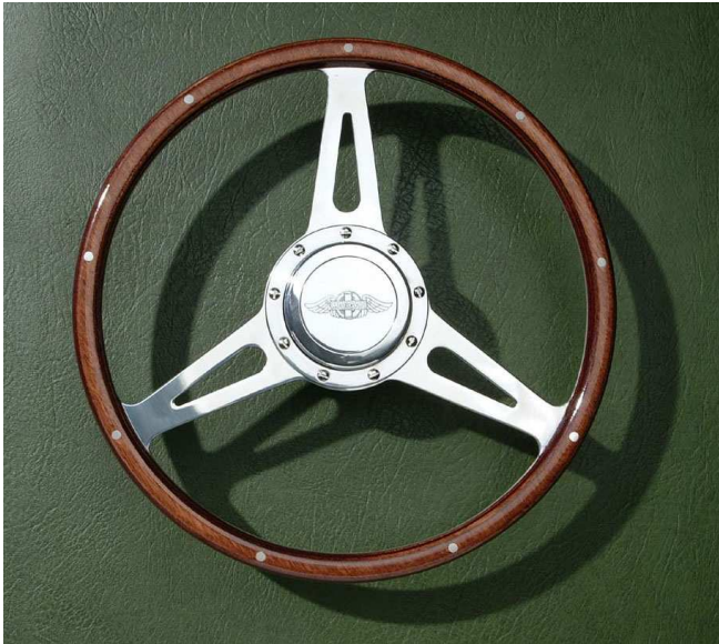
Exécution 15", plat, branches ajourées. Cache central en alu Morgan (option).

Classic3 : Ce modèle particulier avec trois branches et 9 rivets se retrouve fréquemment sur des voitures de courses des années '50 et '60. Disponible en 15" (38cm) ou sur demande en 16" (40.5cm), plat ou tulipé. Les branches peuvent être pleines, percées de trous, fendues ou ajourées telles que représentées ci-contre.