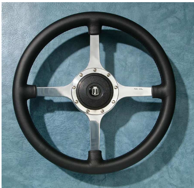
Exécution cuir noir 14", branches alu poli, cache central standard.

Classic4 cuir : Exécution spéciale en cuir du Classic 4. Ce modèle est disponible en 15" avec des branches noires ou en aluminium poli.