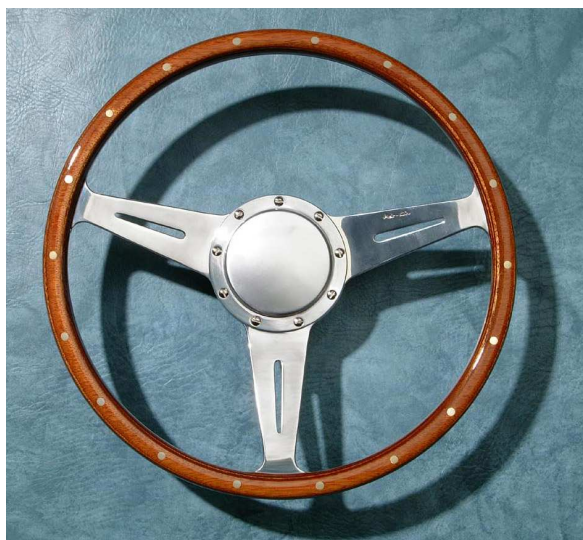
Exécution 14", tulipé, branches à fentes. Cache central en alu (option).