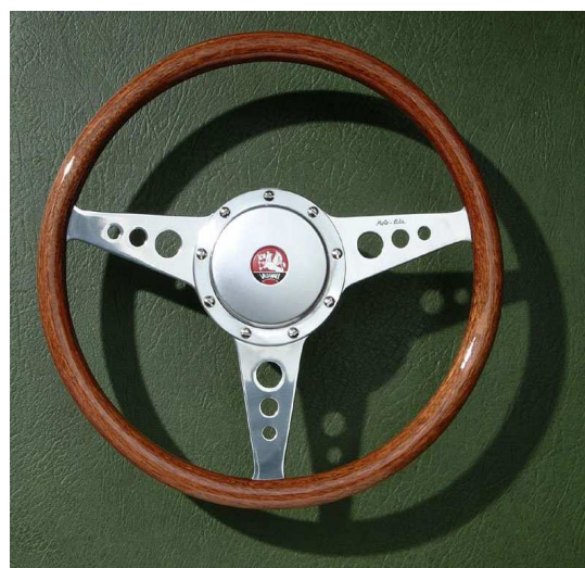
Exécution 14", plat, branches à trous. Cache central en alu (option).