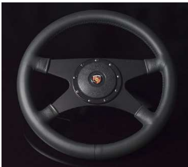
Exécution 14", plat, branches noires, cache standard, badge Porsche.

Eagle 4: Exécution moderne à 4 branches en cuir. Ce modèle est uniquement disponible en 14". Branches noires ou alu poli, plat ou tulipé.