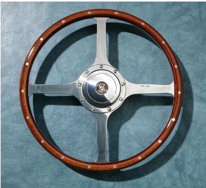
Exécution 15" avec cache central 89mm en alu (option).

Classic 4 : Ce volant à 4 branches pleines est typique des automobiles classiques depuis les années '30. Disponible en 14", 15" ou 16" de diamètre. D'autres versions de ce modèle peuvent être réalisées en essences nobles (Noyer ou Mahogany) ou en cuir.